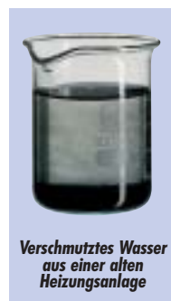
Verschmutztes Wasser aus einer alten Heizungsanlage

Verschmutzungen aus der SYR HeizungsfilterCombi sauber ausspülen. Die Rückspülung erfolgt ohne Druckabfall in der Anlage. Weiteres Plus: Während der Rückspülung gelangt kein Frischwasser in die Heizungsanlage.