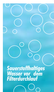
Sauerstoffhaltiges Wasser vor dem Filterdurchlauf