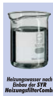
Heizungswasser nach Einbau der SYR HeizungsfilterCombi