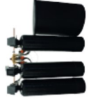
LEX 1500 Connect Serie