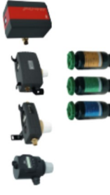
MobiFill und SYR AnschlussCenter 3200, All-in-One und All-in-One+ Connect