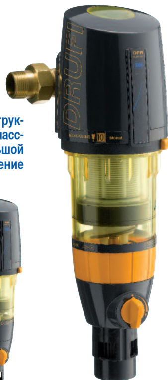
DRUFI+ DFR с обратной промывкой и редуктором давления