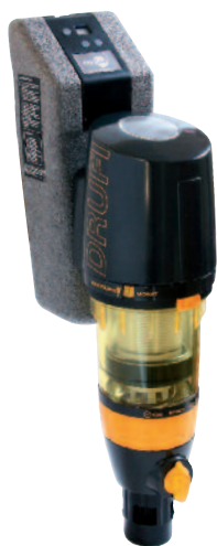
DRUFI+ DFR, SAFE-T с модулем защиты от протечек Safe-T