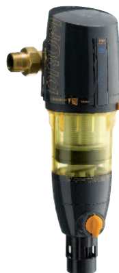
DRUFI+ FR с обратной промывкой