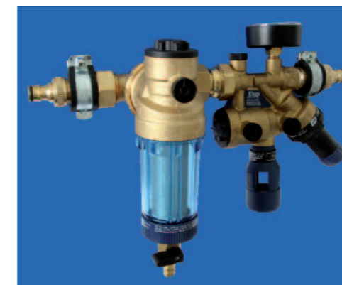
Der integrierte Vorfilter mit normgerechter Füllkombination sorgt für den problemlosen und sicheren Anschluss ans Trinkwassernetz.